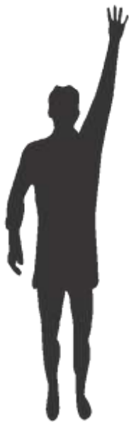
4 sec. regel