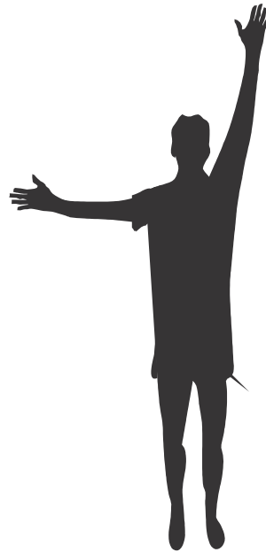
Indirecte vrije schop