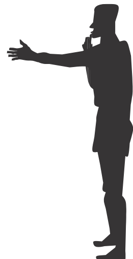
Start en hervatting van het spel (aftrap)