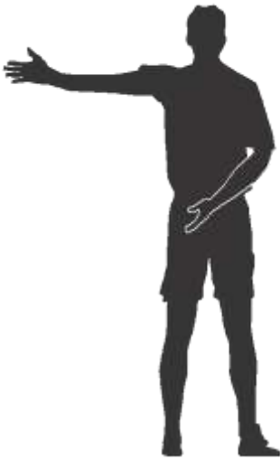
Directe vrije schop